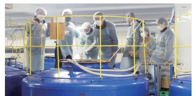
醸造過程の見学会